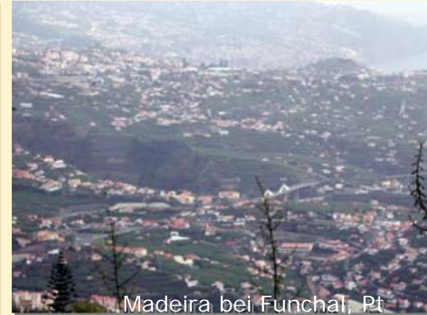
Madeira bei Funchal, Pt